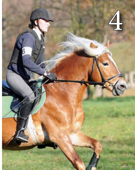
Hengste auf dem Prüfstand

Der Abonnement-Auflage dieser Ausgabe liegt ein Gestüts- und Hengstkatalog des Pony-Park Padenstedt bei. Wir bitten um Beachtung.