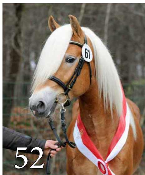
Westfalen: Neue Hengste