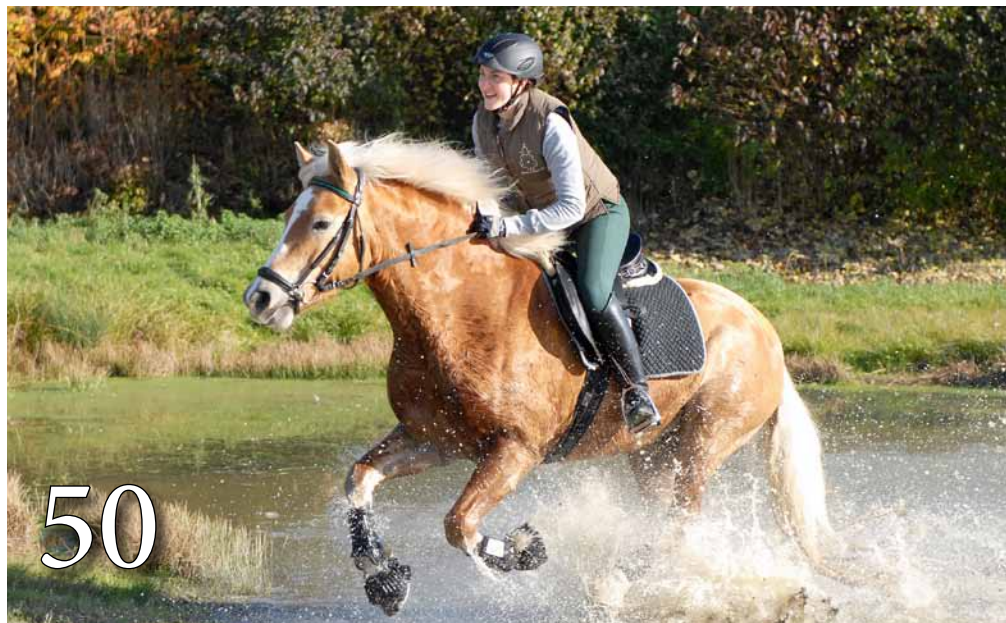
Training mit Haflingern in 5-Sterne-Reitschule