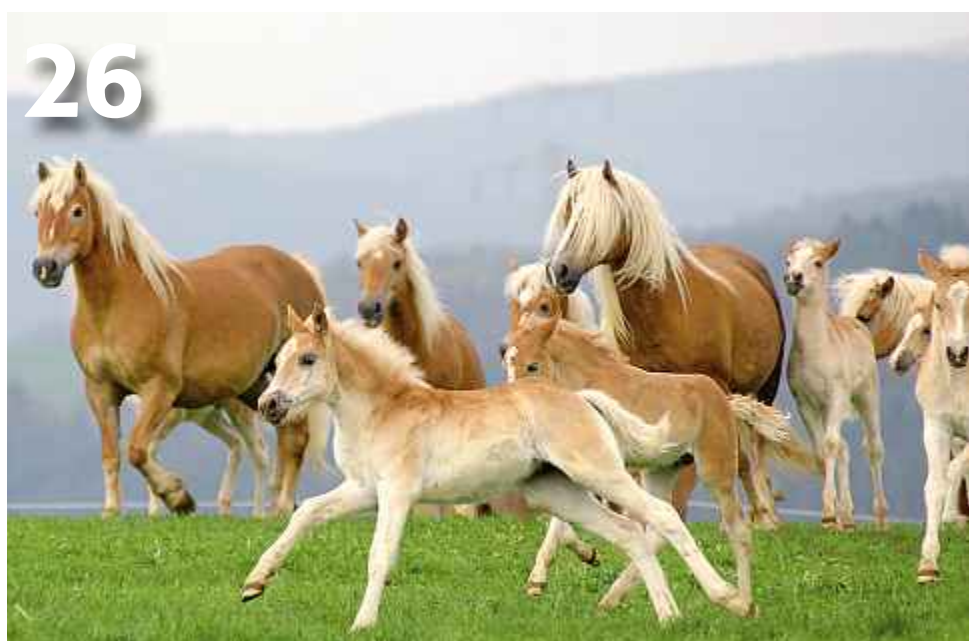
Zucht: Die künstliche Besamung