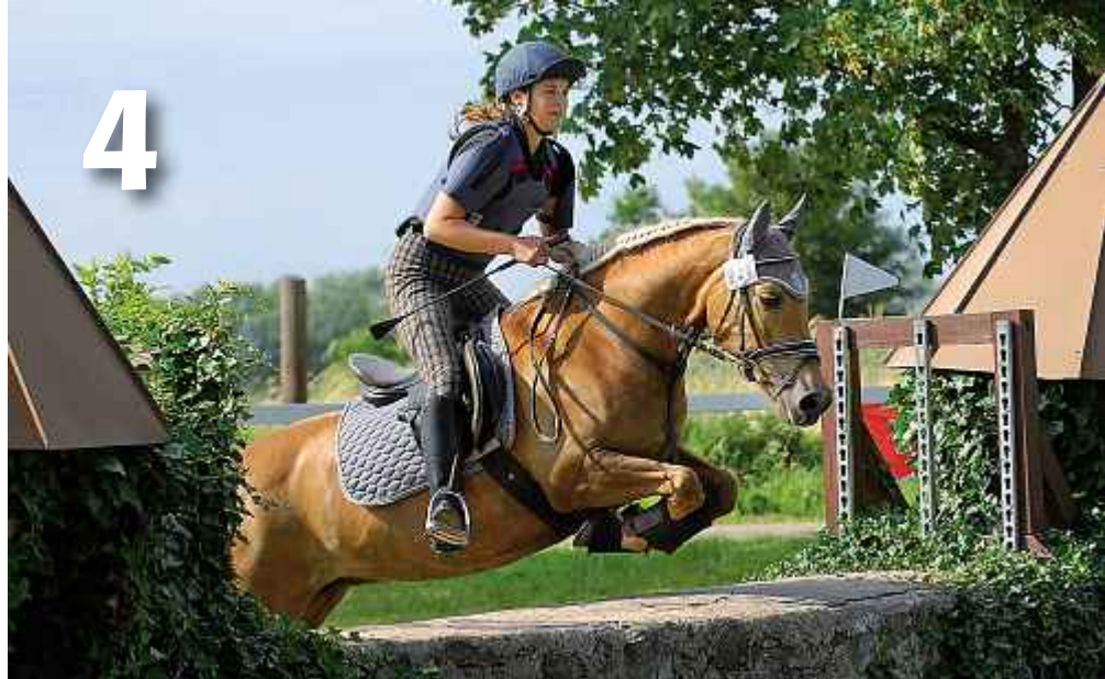
FN-Auswertung: Haflinger im Turniersport