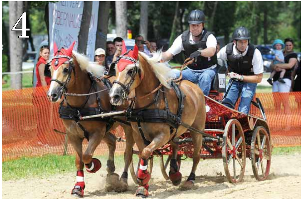
Sport: Europachampionat setzt neue Maßstäbe