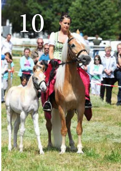
Zucht & Show in der Rhön